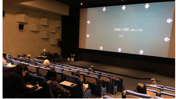
△ 2024 영화제 스크리닝 및 영사 매니저 양성 교육 현장

교육은 12월 3일(수)부터 12월 18일(목)까지 매주 수요일과 목요일, 전주영화제작소 3층 교육실에서 진행되며 교육비는 전액 무료다. 출석률 90% 이상으로 수료한 교육생에게는 제27회 전주국제영화제 스크리닝·영사 매니저 선발 시 서류 전형 우선 통과(1차 합격) 및 면접 전형 가산점의 혜택이 주어진다.